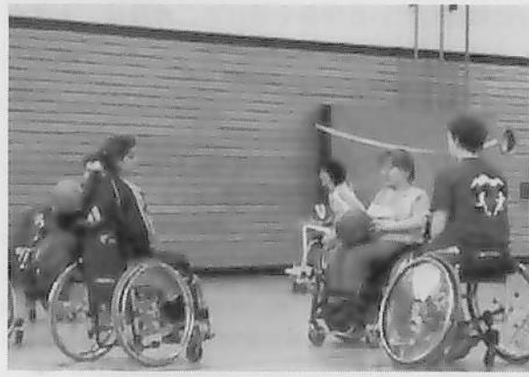
図7 子ども/青年チームのメンバーとコーチ (右)