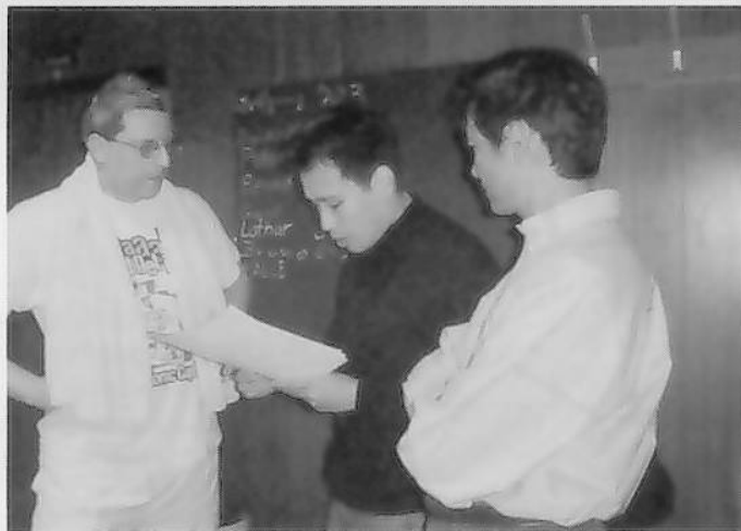
図2 CFCヘルタ06e.V.（ケーゲル部門：Aさんへのインタビュー）

前述した通り、メンバーの高齢化が進んでいる。若者たちのスポーツに対する指向が多様化（サッカーなどの伝統的なスポーツからインラインスケートなどにシフトする傾向がある）していることに加え、ケーゲルがメディアに取り上げられることが少なく情報に触れる機会がほとんどない。前述したイメージの悪さ（飲み屋でやるゲーム）も重なり、子どもに人気がない。プロモーション活動は口コミが中心であり、幾度か新聞に広告掲載などをしたが、若年層の食いつきは良くなかった。クラブ数は、現在ベルリン市内で100から150クラブである。以前はドイツ全体で8000クラブ（80年代）、現在はおよそ3000クラブ程度まで減少している。また、ケーゲルをやる場所自体も減少してきている。かつては40レーン以上の規模の施設があったが、今の場所（26レーン）に移動して活動している。東西ドイツの統一前は国や行政から指導者に対する交通費などの支援が出ていたが、今は国や行政からの補助金はない。