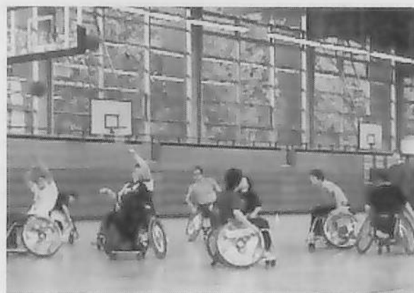
図9 大人のチームの練習風景