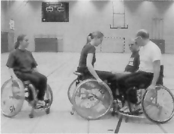
図4 コーチによる個別の指導