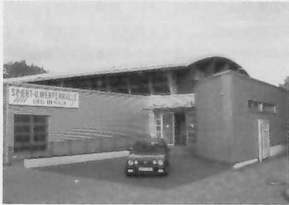
図6 練習会場のリリーヘノッホ体育館

全体として練習中は軽快な音楽を流しながら、楽しい雰囲気の中で練習に取り組めるような工夫が行われていたが、競技性重視の大人の練習では、コーチの厳しい指摘と注意が飛び交い、緊迫した雰囲気の練習が展開されていた。