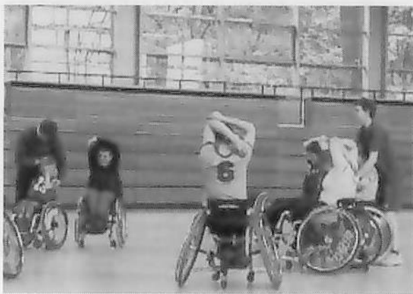
図8 準備運動 (ストレッチ)