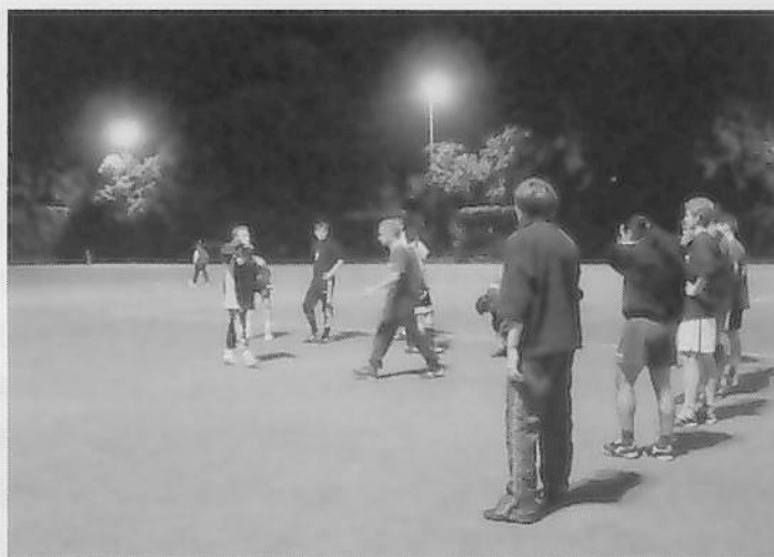
図1 小学校のグラウンドで活動するFCグリーネヴァルト1957e.V.

図1に示すとおり、各年代のチームごとに練習を行い、練習終了後は、小学校の倉庫に置いてある冷蔵庫からビールやジュースを出して語らう姿が見られた。