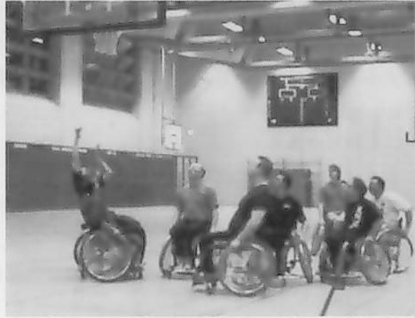
図5 ゲーム形式の練習